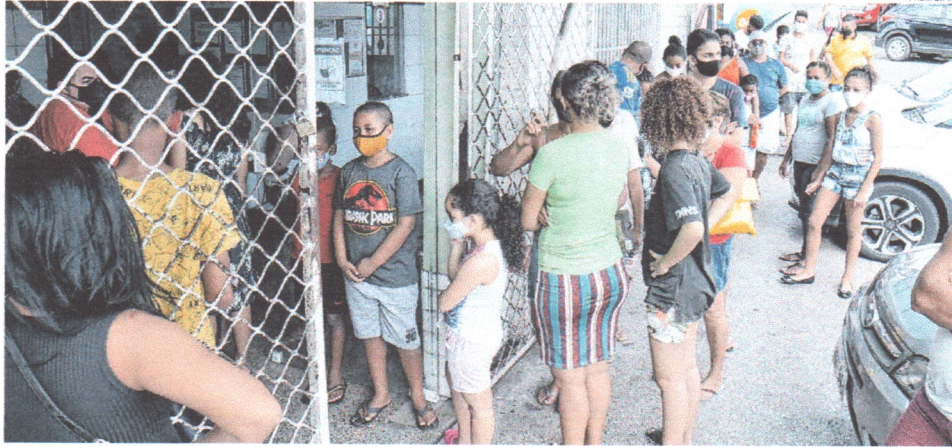
Com a liberação da vacina contra a gripe pela prefeitura, longas filas se formaram na capital maranhense, como neste posto de Saúde, localizado no Bairro de Fátima